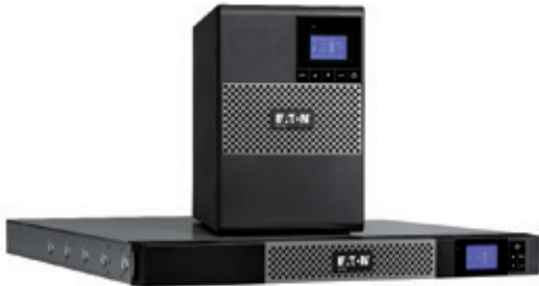
Als Tower- und als 1HE-Rackversion erhältlich