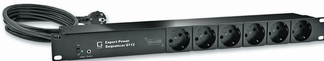
Expert Power Sequencer 8112-3 und 8112-4 mit 6 Schutzkontakt-Anschlüssen auf der Frontseite

Betreiber von Audio-Racks profitieren von der Schaltsequenz des Expert Power Sequencer 8112