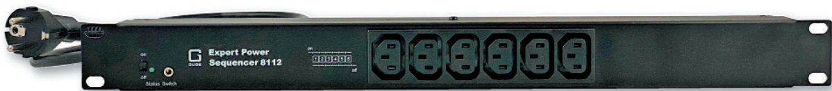
Expert Power Sequencer 8112-1 und 8112-2 mit 6 IEC C13-Anschlüssen auf der Frontseite

Der Expert Power Sequencer 8112 kommt beispielsweise in AV-Installationen mit einer Endstufe zum Einsatz. Der dort verwendete Audioverstärker wird am letzten Lastausgang angeschlossen. Die PDU sorgt nun dafür, dass der Verstärker nach den anderen Komponenten als letztes eingeschaltet wird. Beim Ausschalten in umgekehrter Reihenfolge wird er vor den anderen Komponenten als erstes geschaltet. Die andernfalls auftretenden Knallgeräusche, die nicht nur unangenehm sein können, sondern auch Lautsprecher und Verstärker schädigen können, gehören damit der Vergangenheit an.